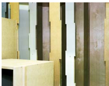
Nicolas Delaroche, Harmonie , 23 mai 2008, Capharnaüm , 2008 © Nicolas Delaroche/ECAL

L'exposition sera ouverte du lundi au vendredi de 8h à 18h et fermée le week-end.