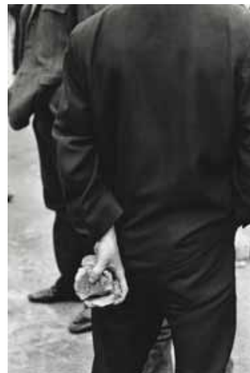
Gilles Caron, Manifestation anti-catholiques de l'ordre d'Orange . Londonderry, Irlande du Nord, août 1969.

Le Musée de l'Elysée accueille dans ses collections, 150 tirages du photographe français Gilles Caron. Donation de la Fondation Gilles Caron basée à Genève, cette collection rend compte des événements internationaux majeurs de la fin des années soixante : guerre des Six jours (Israël, 1967), guerre du Vietnam (1967), Mai 68 à Paris, Biafra (Nigeria, 1968), Prague (Tchécoslovaquie, 1969) et guerre civile en Irlande du Nord (1969). Le photoreporter réalise ces séries pour l'agence de presse Gamma qu'il co-fonde notamment avec Raymond Depardon. Les tirages offerts au Musée de l'Elysée, pour certains reproduits en un seul exemplaire, ont été réalisés à partir de planches contact et de négatifs presse déposés et conservés à la Fondation Gilles Caron. Pour marquer cet événement, une partie de ces tirages et des documentaires seront projetés en continu à la Salle Lumières du Musée de l'Elysée.