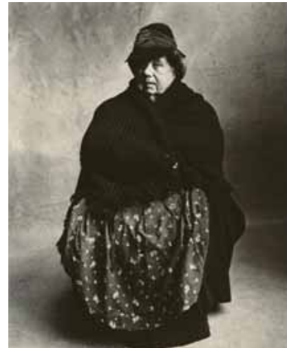
Irving Penn, Vehicle Watcher ( Gardiennne de voitures ), Londres, 1950 © Condé Nast Publications, Ltd.

Recrutés dans la rue, les modèles se rendaient au studio du photographe, dans leurs tenues de travail. En plus des petits vendeurs traditionnels, Penn photographiait également les gens de la pittoresque classe ouvrière du quartier Mouffetard, comme les sculpteurs bohêmes ou la chanteuse Benoite Lab. Irving Penn poursuit son projet à Londres en septembre de la même année et continua son exploration des métiers de retour à New York. Ayant à l'esprit combien ces ouvriers s'identifiaient à leur travail, il a sciemment inclus leurs outils (comme leurs tenues) dans ses portraits. En convoquant « les petits métiers » dans le territoire neutre du studio, Penn démontrait ainsi son intérêt pour l'individualité des modèles plus que pour leur milieu social.