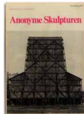
Anonyme Skulpturen , Kunst Zeitung n°2. Page de couverture. Verlag Michelpresse, Düsseldorf, janvier 1969.

Depuis la fin des années 1950, le travail photographique de Bernd et Hilla Becher porte sur des paysages et bâtiments industriels, notamment des usines, des châteaux d'eau, des hauts-fourneaux, des chevalements, des silos à charbon, généralement à l'abandon. Leur démarche peut être qualifiée de scientifique dans le sens où leurs clichés sont classés et archivés selon leurs emplacements géographiques ou leurs fonctionnalités. Ces architectures industrielles photographiées sous la même lumière neutre et selon des paramètres identiques apparaissent comme des sculptures détachées de leur contexte.