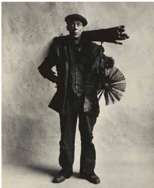
Irving Penn, Chimney Sweep (Ramoneur) , Londres, 1950

VERNISSAGE DES EXPOSITIONS Vendredi 8 octobre à 18h00